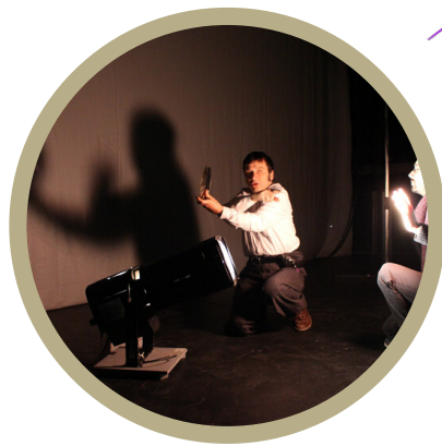
Partage de patrimoines techniques Charleville-Mézières / Châlons-en-Champagne, janvier 2016