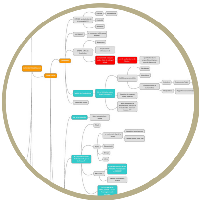
Grammaires de l'illusion HorsLesMurs, Paris, avril 2015

Laboratoires d'échanges de pratiques et de savoir-faire spécifiques aux arts de la marionnette et aux arts de la magie