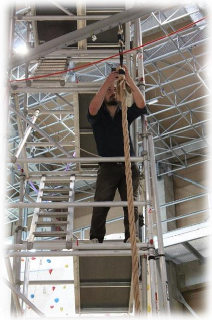
Figure 1 – Mesure statique.