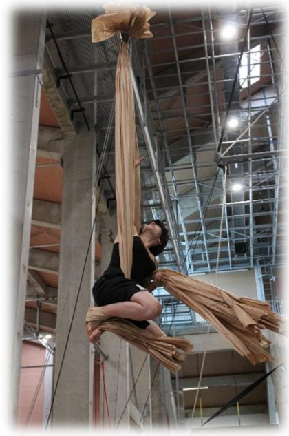
Figure 2 – Mesure en dynamique.