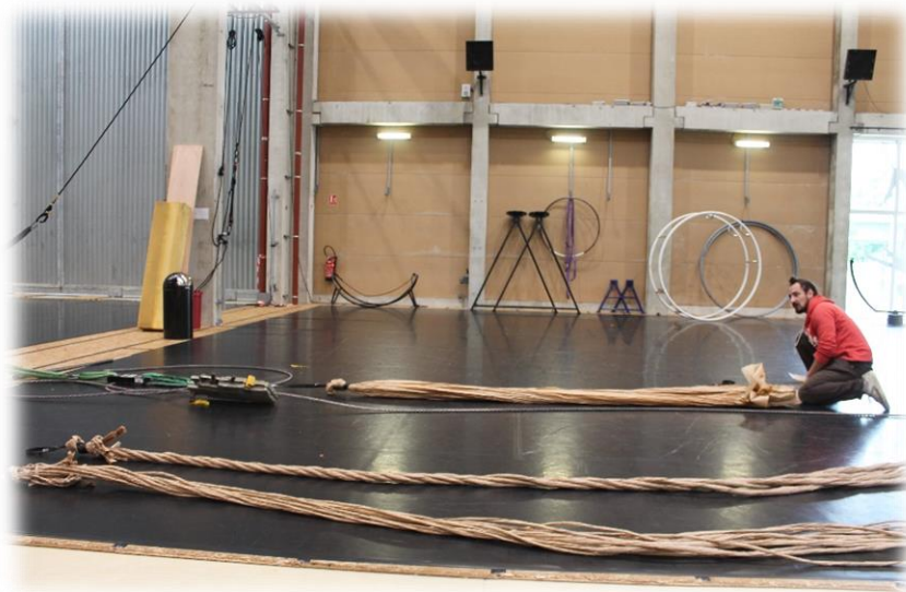
Figure 3 – Test de traction à la déchirure.