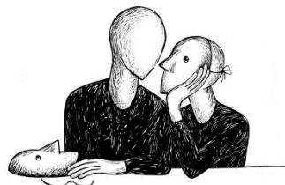
© Laurette Burgholzer pour la compagnie Incisive

Laurette dessine des visuels de communication et des logos pour des compagnies. En collaboration avec la compagnie Incisive (Lola Kil), elle crée des dessins pour le projet de spectacle De l'autre côté (de toi) . Ils constituent un outil dramaturgique qui permet de traiter les thématiques du spectacle : ce qu'on ne peut capter dans l'autre, la zone d'ombre des êtres qui nous sont proches. Cela soulève la question de la perspective du regard qu'on pose sur des dessins ou sur un être humain. Ce support est réalisé petit à petit à partir des discussions de l'équipe de création. L'aspect esthétique est librement inspiré du Moyen Âge, avec des disproportions.